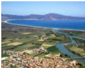
Sant Pere Pescador