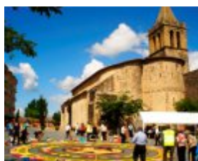
Maçanet de la Selva

Preestrena coproducció DIUMENGE 27 D'AGOST Figueres Coproducció FITAG 2017 Obra: El barret de copa