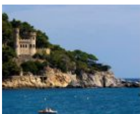
Lloret de Mar